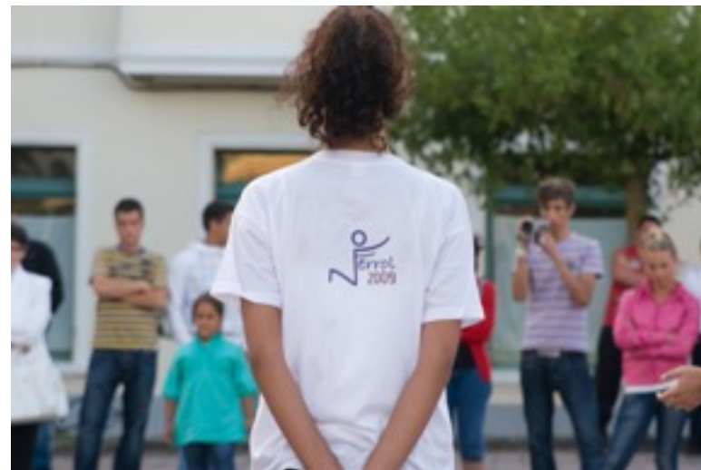
mision ESPERANÇA 2009